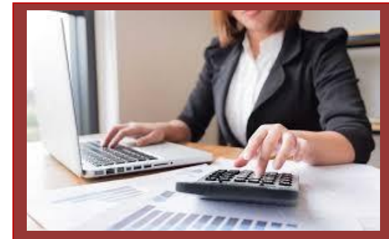
บัณฑิต นักบัญชี นักปฏิบัติ